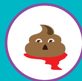
ПРИМЕСИ В КАЛЕ (СЛИЗЬ, КРОВЬ)