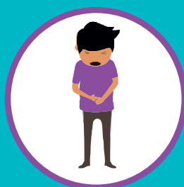
БОЛЬ В ЖИВОТЕ