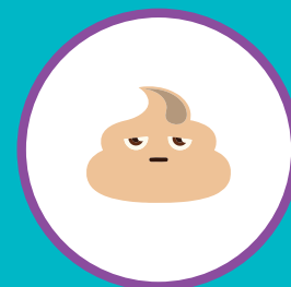
ИЗМЕНЕНИЕ ЦВЕТА КАЛА