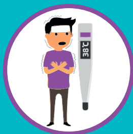
ПОВЫШЕННАЯ ТЕМПЕРАТУРА ТЕЛА