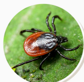
размер в зависимости от вида 3-25 мм